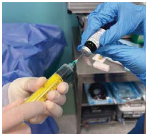
Рис. 1. Інтраопераційне приготування розчину ICG