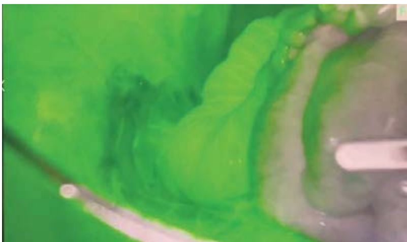
Рис. 2. Флуоресцентна візуалізація кишечника під час резекції