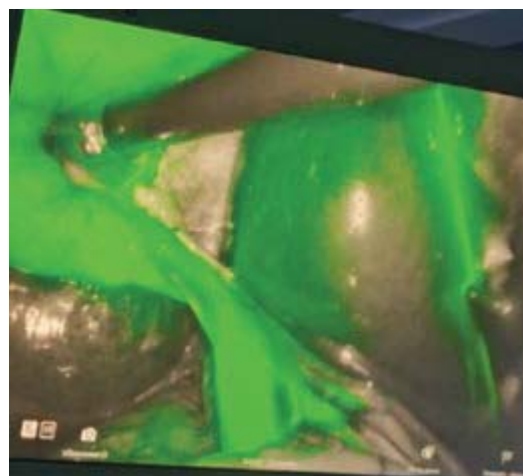
Рис. 4. ICG-навігація під час операції на жовчних шляхах