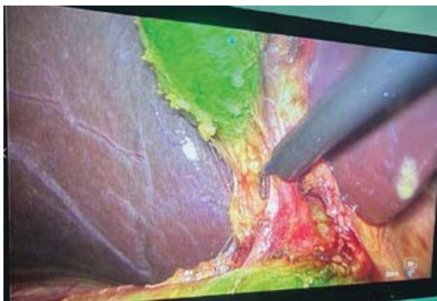
Рис. 7. ICG-навігація судинних структур жовчаних