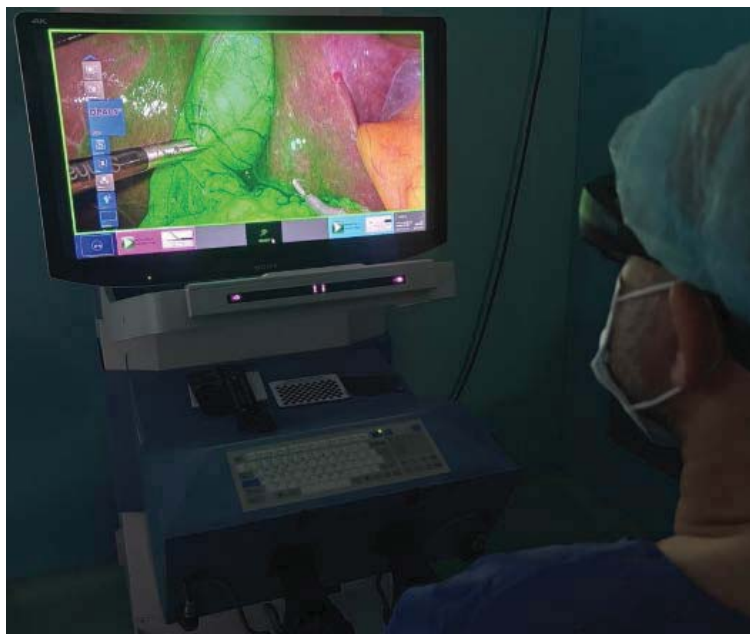
Рис. 6. ICG-навігація з кокпіту роботичної системи