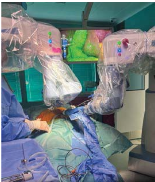
Рис. 5. ICG-навігація в роботичній холецистектомії