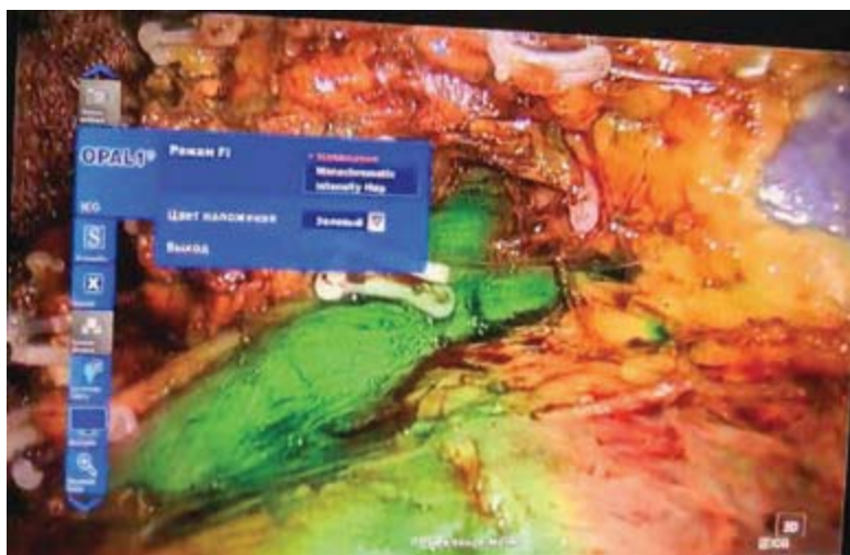
Рис. 3. ICG-навігація під час резекції нирки