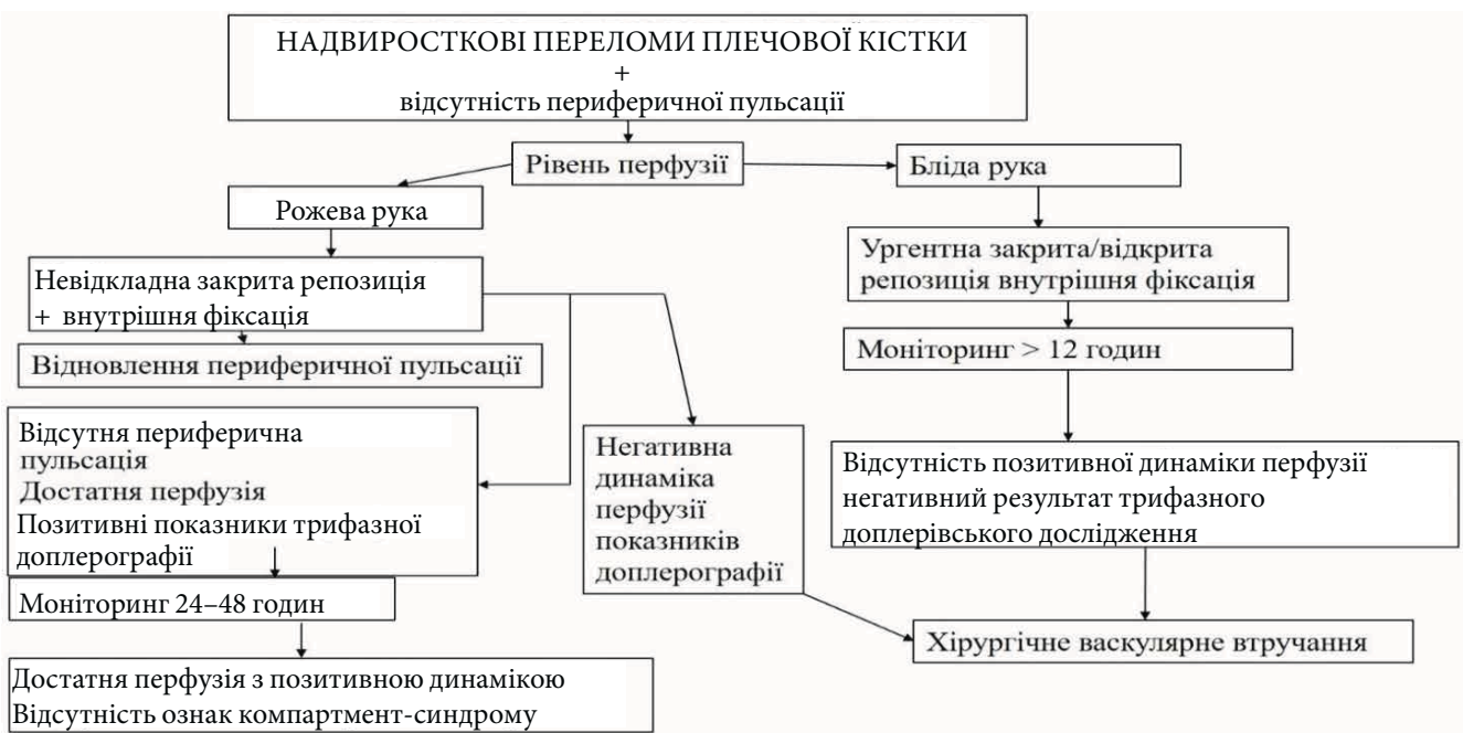
Рис. 2. Алгоритм дій лікаря в разі порушення перфузії кінцівки