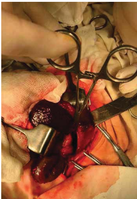
Рис. 1. Дефект діафрагми типу В (згідно з класифікацією CDHSG) у новонародженої дитини з природженою діафрагмальною грижею