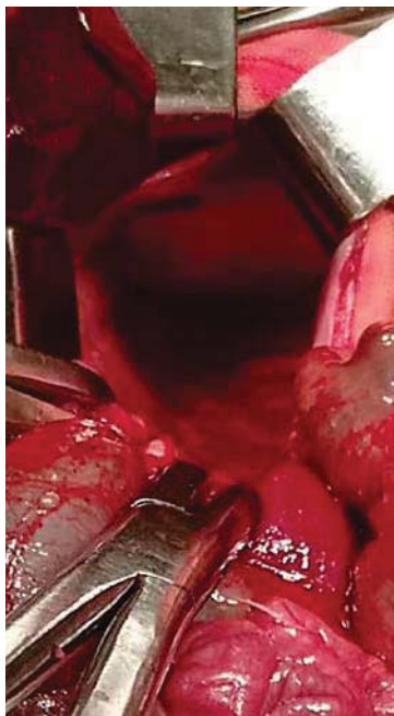
Рис. 2. Дефект діафрагми типу С (згідно з класифікацією CDHSG) у новонародженої дитини з природженою діафрагмальною грижею