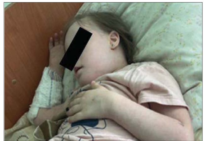
Рис. 2. Стан на момент госпіталізації