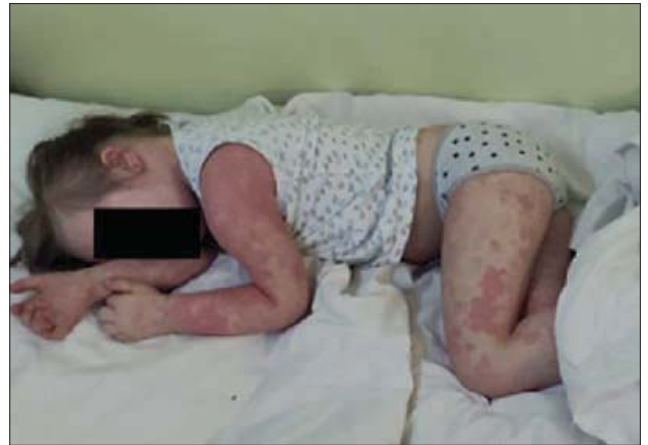
Рис. 1. Вимушене положення пацієнта

У пункті кісткового мозку: функція червоного паростка знижена, гранулоцитарний