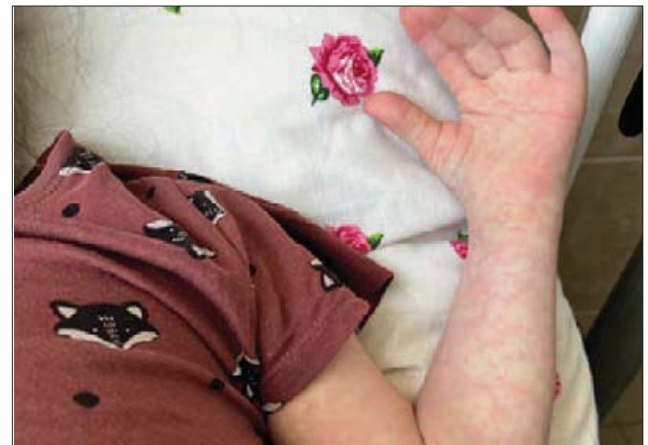
Рис. 3. Висип на тулубі та кінцівках

паросток без патологічних змін, функція мегакаріоцитарного паростка без особливостей. Проведено спіральню-комп'ютерну томографію органів грудної та черевної порожнини: зміни в легенях за рахунок ВВС. Трахеальний бронх праворуч, аберантна права підключична артерія, додаткова ліва верхня порожниста вена, яка дрениється в коронарний синус. Високе відходження верхньої брижової артерії. Помірна лімфаденопатія пахвових і здухвинно-ободових лімфатичних вузлів. Помірна гепатомегалія.