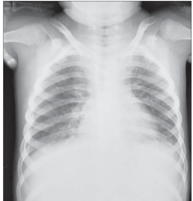
Рис. 4. Рентгенографія органів грудної клітки

Враховуючи Rø-картину, появу стоматиту, відмінено цефотаксим, а призначено в/в меро-