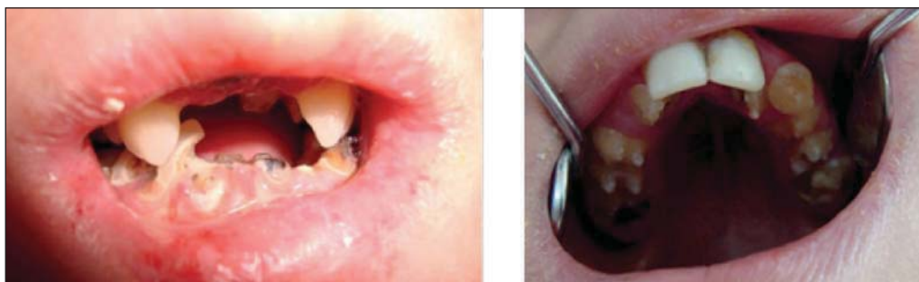
Рис. 1. Множинний карієс та зубощелепні аномалії в пацієнта з бульозним епідермолізом [4]

На кафедру стоматології дитячого віку Львівського національного медичного університету імені Данила Галицького звернувся пацієнт Х., віком 16 років, зі скаргами на постійний ниючий біль, посилення болю при накушуванні та відчуття розпирання в зубі 23. З анамнезу відомо, що пацієнт страждає на дистрофічну форму БЕ (діагноз встановлено в кабінеті бульозного епідермолізу Національної дитячої спеціалізованої лікарні «ОХМАТДИТ», м. Київ). У пацієнта наявні характерні для цього захворювання симптоми: кератодермія, ділянки атрофії шкіри, рубці, вогнищева алопеція, ураження очей, обструкція слюзовивідних каналів, деформації кінцівок, контрактури, зростання пальців (псевдосиндактилія), відсутність нігтів (рис. 2).