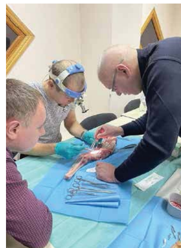
Практичні заняття для фахівців

дитячої хірургії та урології Вроцлавського медичного університету, Польща; професор Текгюль Сердар, Президент Європейського товариства дитячої урології, професор і завідувач кафедри дитячої урології, Університет Хаджеттепе, медична школа, Анкара, Туреччина; професор Мюр П'єр-Ів, Hospices Civils de Lyon (Ліонська університетська лікарня) / Відділення дитячої урівісцеральної та торакальної хірургії CHU Lyon (HFME); професор Хакан Агір, професор пластичної, реконструктивної та естетичної хірургії, член Європейських рад пластичної, реконструктивної та естетичної хірургії – U.E. M.S., ESPRAS, EBOPRAS, Міжнародного товариства пластичної, реконструктивної та естетичної хірургії (ISPRAS), Міжнародного товариства естетичної пластичної хірургії (ISAPS), Австралійського товариства голови та шиї (ANZ), реконструктивної та естетичної хірургії, щелепно-лицьової хірургії та реконструктивної мікрохірургії, клініка Аджібадем, Стамбул, Туреччина; професор Ейдельман Марк, ортопед, завідувач відділення дитячої ортопедії, Рамбам, Хайфа, Ізраїль, медичний центр.