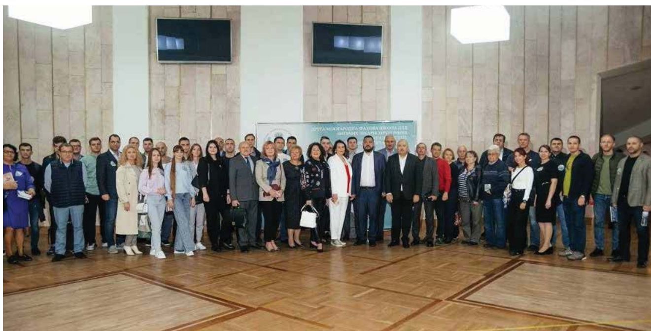
Спільне фото учасників конференції