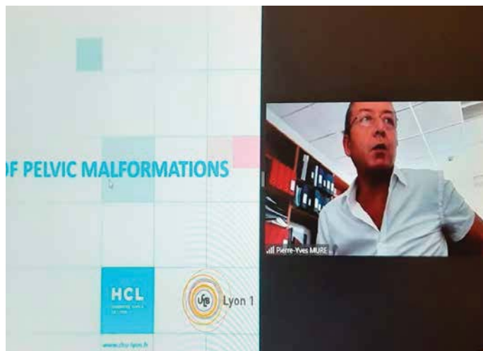
Пряме включення з Франції: професор П'єр-Ів Мюр

Війна спричинила нові виклики для фахівців медичної сфери, тому дуже важливо не зупинятися в розвитку, оскільки це – наш фронт, на якому ми зможемо здобути перемогу, об'єднавшись і продовжуючи навчання.