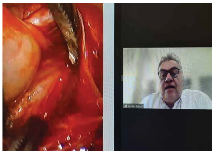
Пряме включення з Туреччини: професор Сердар Текгюль