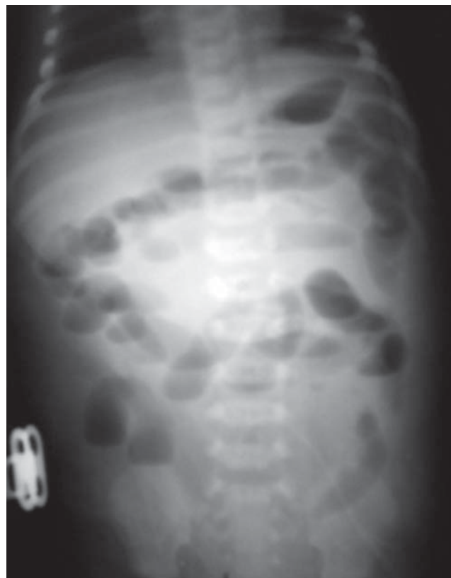
Рис. 2. Рентгенологічні ознаки парезу кишечника

Хлопчик Г. народився в ЦРЛ Чернігівської області в 33 тижні гестації 01.01.2013 р., стрімкі пологи, оцінка за шкалою Апгар 8–9 балів. На третю добу після народження дитина реанімобілем доправлена до ЧОДЛ через наростання дихальної недостатності та погіршення загального стану. При надходженні стан важкий, дихальна недостатність III ст., проводилась інтенсивна