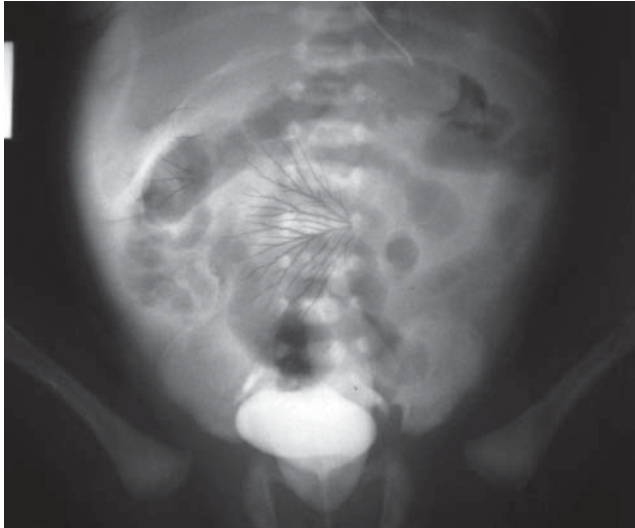
Рис. 3. Цистографія. Потраплення контрастної речовини за межі контуру сечового міхура. Розрив сечового міхура