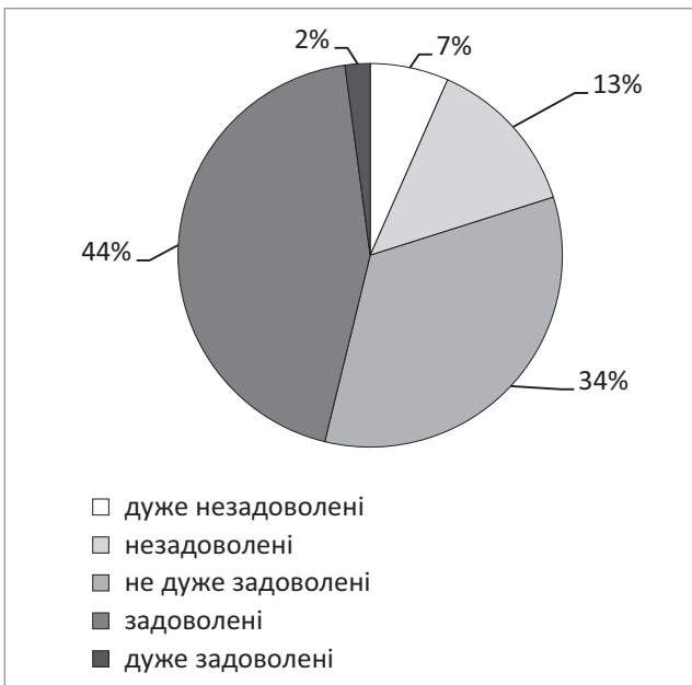
Рис. 2. Ставлення домогосподарств (частка, %) з двома дітьми до власних житлових умов (1189,2 тис. домогосподарств, 2016 р.).

воленіх житловими умовами у містах більше — 56,7 % проти 43,1 % у селі, при цьому частка дуже задоволених житловими умовами домогосподарств з дітьми вища у селі (2,7 %), ніж у таких домогосподарств, що мешкають у містах (1,6 %). У цілому по Україні у 2016 р. частка домогосподарств із дітьми вкрай не задоволених, незадоволених та не дуже задоволених житловими умовами у містах становила 41,7 %, у сільській місцевості — 54,2 %. Також простежується тенденція зростання частки незадоволених житловими умовами зі збіль-