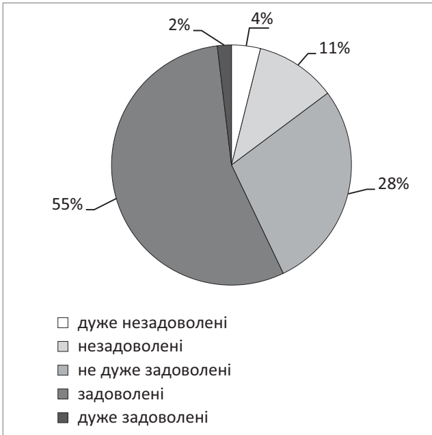
Рис. 1. Ставлення домогосподарств (частка, %) з однією дитиною до власних житлових умов (4386,7 тис. домогосподарств, 2016 р.)