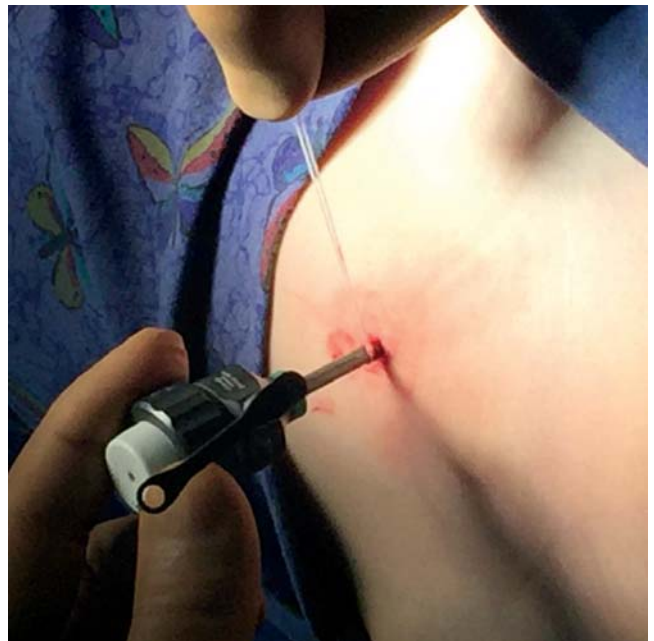
Рис. 3. После извлечения иглы охватывающая троакар нить завязана вокруг троакара, надежно его фиксируя

земы, которая зафиксирована у 17 (62,9%) детей первой группы. Во второй группе подкожную эмфизему после операции наблюдали лишь у 1 (3,8%) ребенка. Во всех случаях подкожная эмфизема разрешалась без специальных манипуляций и не сопровождалась возникновением раневых осложнений.