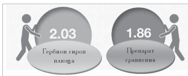
Рис. 2. Среднее снижение частоты кашля (в баллах) — межгрупповое сравнение

В обеих группах частота кашля изменялась: с частого кашля, снижающего дневную активность, на единичные кашлевые толчки, не влияющие на дневную активность. Конечная точка означает среднее изменение частоты кашля по 6-балльной категориальной шкале на исходном уровне и после лечения. Показатели средних значений CFRC исследуемого препарата и препарата сравнения составили 2,03±0,96 и 1,86±0,86 соответственно (рис. 2). Средняя разница между двумя исследуемыми препаратами составила 0,175 балла в пользу препарата Гербион сироп плюща ( p=0,284 , 95% доверительный интервал 0,147–0,497). Статистически